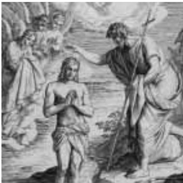
aus: J. Schnorr von Carolsfeld: "Die Bibel in Bildern", © Copyright 1990 by Hänssler Verlag, D-71087 Holzgerlingen – „Taufe Jesu“

Als Zeichen der Abkehr von einem gottesfernen Leben taufte Johannes die Täuflinge im Fluss Jordan. Das Untertauchen und anschließende Wiederauftauchen symbolisierte die Wende im Dasein und den Anfang eines neuen, befreiten Lebens, umschlossen und beschützt von Gottes Liebe. Diese Bedeutung spiegelt sich bis heute im Gebrauch des Taufwassers wider.