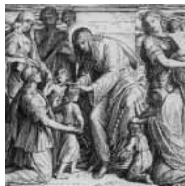
aus: J. Schnorr von Carolsfeld: "Die Bibel in Bildern", © Copyright 1990 by Hänssler Verlag, D-71087 Holzgerlingen – „Jesus segnet die Kinder“

„Lasst die Kinder zu mir kommen und wehret ihnen nicht; denn solchen gehört das Reich Gottes.“ Markus 10,14